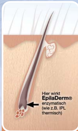
Fig 1: Haarfollikel in der Wachstumsphase

Nach der Enthaarung mit der EpilaDerm®-Zuckerpaste wird der EpilaDerm®-Enzymkomplex zur enzymatischen Haarwuchsreduktion und zur Pflege der Haut aufgetragen*.